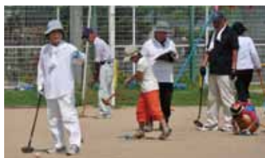
グランドゴルフに興じる三世代

又高城山は、山火事後で山頂に松の木のみが残っています。火災後の灰で数年間はワラビが良く生え、毎年多くの人が採集に登ったものです。