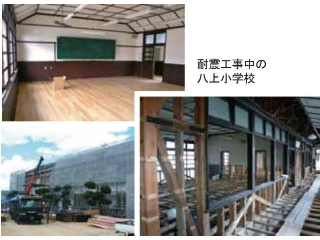
耐震工事中の八上小学校

平成22年度の講堂の耐震補強工事に続き、現在兵庫県下初の木造校舎の耐震改修工事が行われ、全国的にも注目されています。工事は「じょうぶ」であるための耐震補強工事と「きれい」であるための一般改修工事が同時に進められ、木造校舎は大きく生まれ変わります。