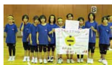
3位入賞の5年生女子

③【平成19年】②の時代から更に54年が経過しました。王地山山頂からの眺望も現在では木の繁茂で全く見え、5年前のどうにか八上地区が望める写真です。近年の時の流れは、加速度的に大きな変化をもたらしたことが歴然と判ります。今では、のんびりとした昔の情景が懐かしく憶はれます。