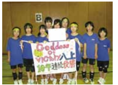
完全優勝の6年生女子

平成24年7月15日(日)篠山市スポーツセンターで篠山市子ども会ふれあいスポーツ大会が行われました。ソフトボール(男子の部)では、6年生、八上ひよこクラブが、第1試合、北小オールスターズ(西紀北小)と0対4、第2試合は西紀ファイターズ(西紀小)と1対0で1勝1敗となり、失点が少なかったためDブロックで準優勝しました。ドッジボール(女子の部)では、5年生Strong Girls八上は、まめつ子ドラゴン南(西紀南小)と12対11、南ハッピースマイル(西紀南小)と9対10、大山TENシスターズ(大山小)と15対2、岡野11Stars(岡野小)と4対10の2勝2敗で3位に入賞しました。