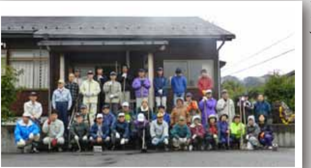
殿町自治会の皆さん

殿町は、八上の南東に位置し、東に八上城、南に奥谷城（蕪丸）（かぶらまる）、西に法光寺城と三方を山城に囲まれた自治会です。集落名は昭和33年に「奥谷」から高城山の麓であり、以前から小字に殿町があり、公民館の建替えと同時にその地名を採用し、「殿町」に改名されました。