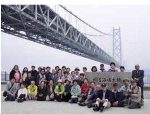
明石海峡大橋を真上に記念撮影(於)海上プロムナード

たくさん食べて、たくさん買い物をして、バスの積載重量は重くなりましたが、いろいろなものを観て、いっばい話をし、笑って…心はとても軽くなった一日でした。