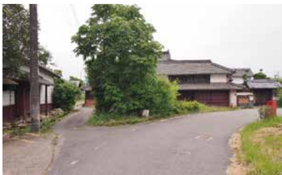
重兵衛茶屋前のL字状に屈曲する角地

現在、道路元標は旧19町村のうち5か所が不明であり、現存するものでも当初と異なる場所に移設されたものもあります。人や車が往来する道の傍には、人々が信仰や供養のための道祖神や供養碑、往來の安全を祈る道標があります。道路元標は国が道路を管理するため設置した標柱と言えます。